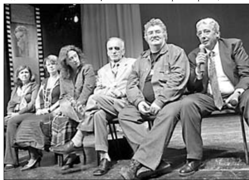
На открытии «Саратовских страданий» в 2006 году

Побывали наши «страдальцы» и на фестивале «Послание к человеку» в Питере, и на «Кинотавре». И везде старались отобрать картины для конкурсного показа. Культурные связи постепенно расширяются, что должно сказаться на программе. На питерском фестивале некоторые режиссеры специально подошли к делегатам «Страданий» и предлагали свои новые работы. Это говорит о том, что в киношной тусовке фестивалю знают. Удастся ли организаторам добиться аналогичной известности у зрителей, узнаем в начале ноября.